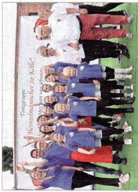
Gut gelaunt wie jedes Jahr feierten die Heinzelmännchen auf ihrem beliebten Sommerfest.